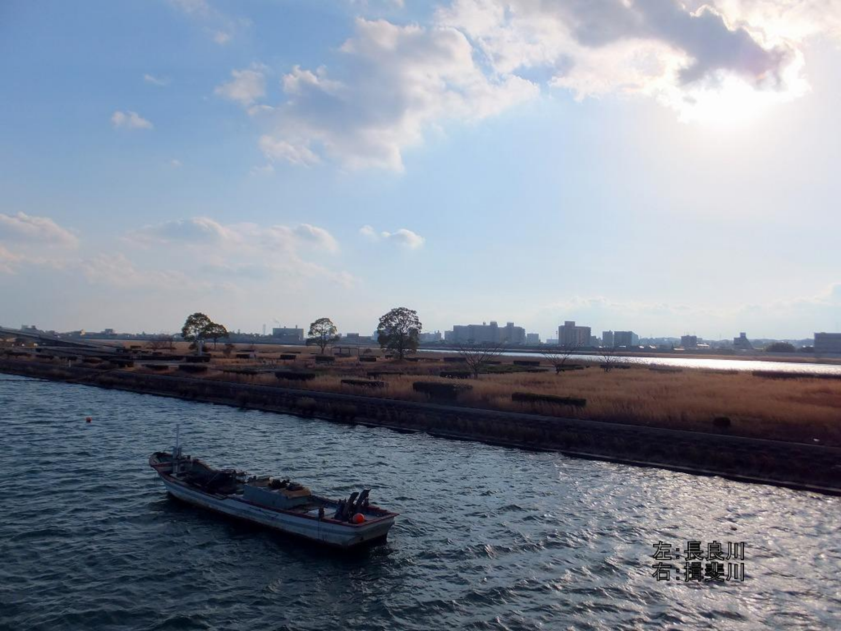
左:長良川 右:揖斐川