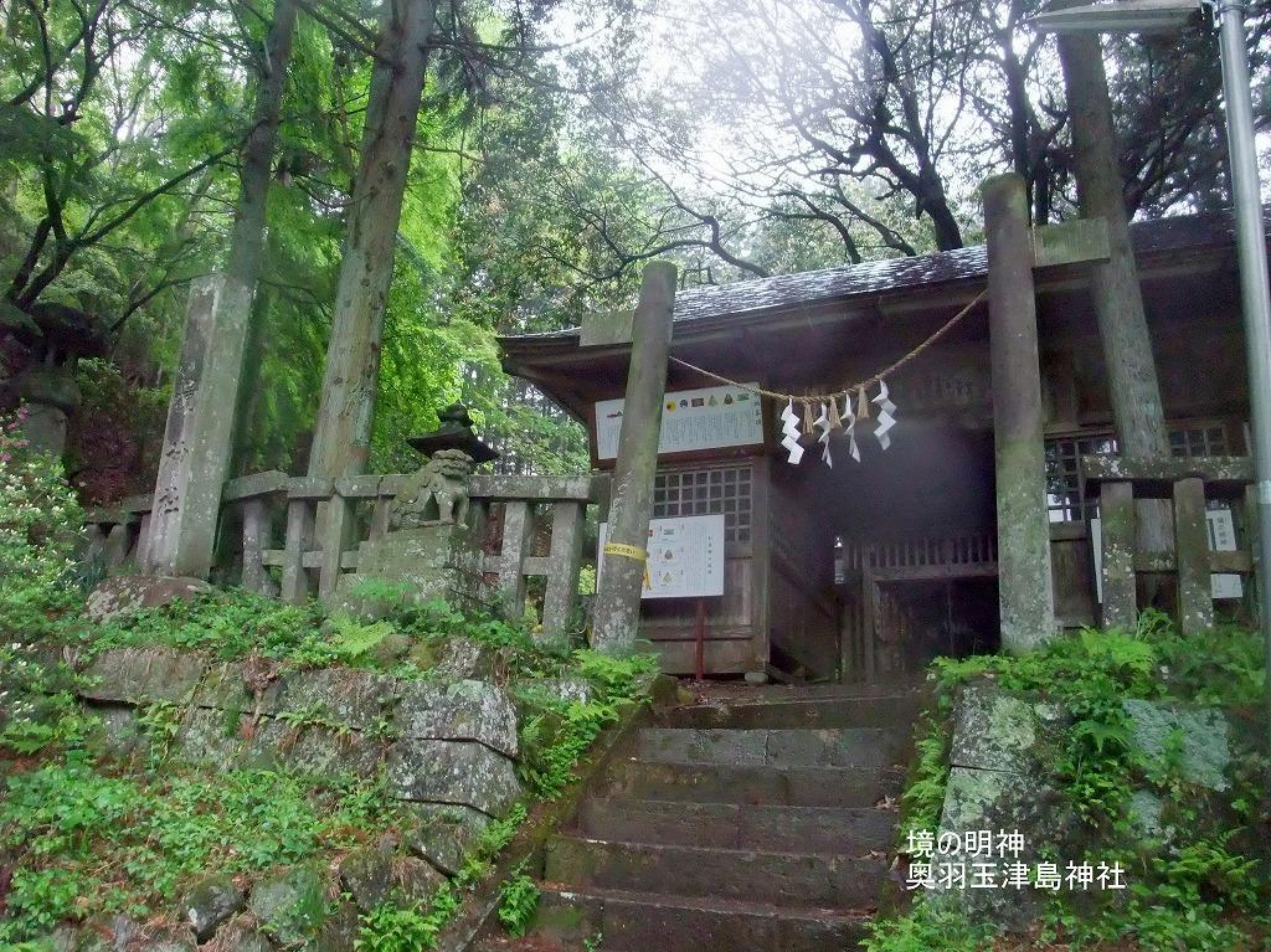
境の明神 奥羽玉津島神社