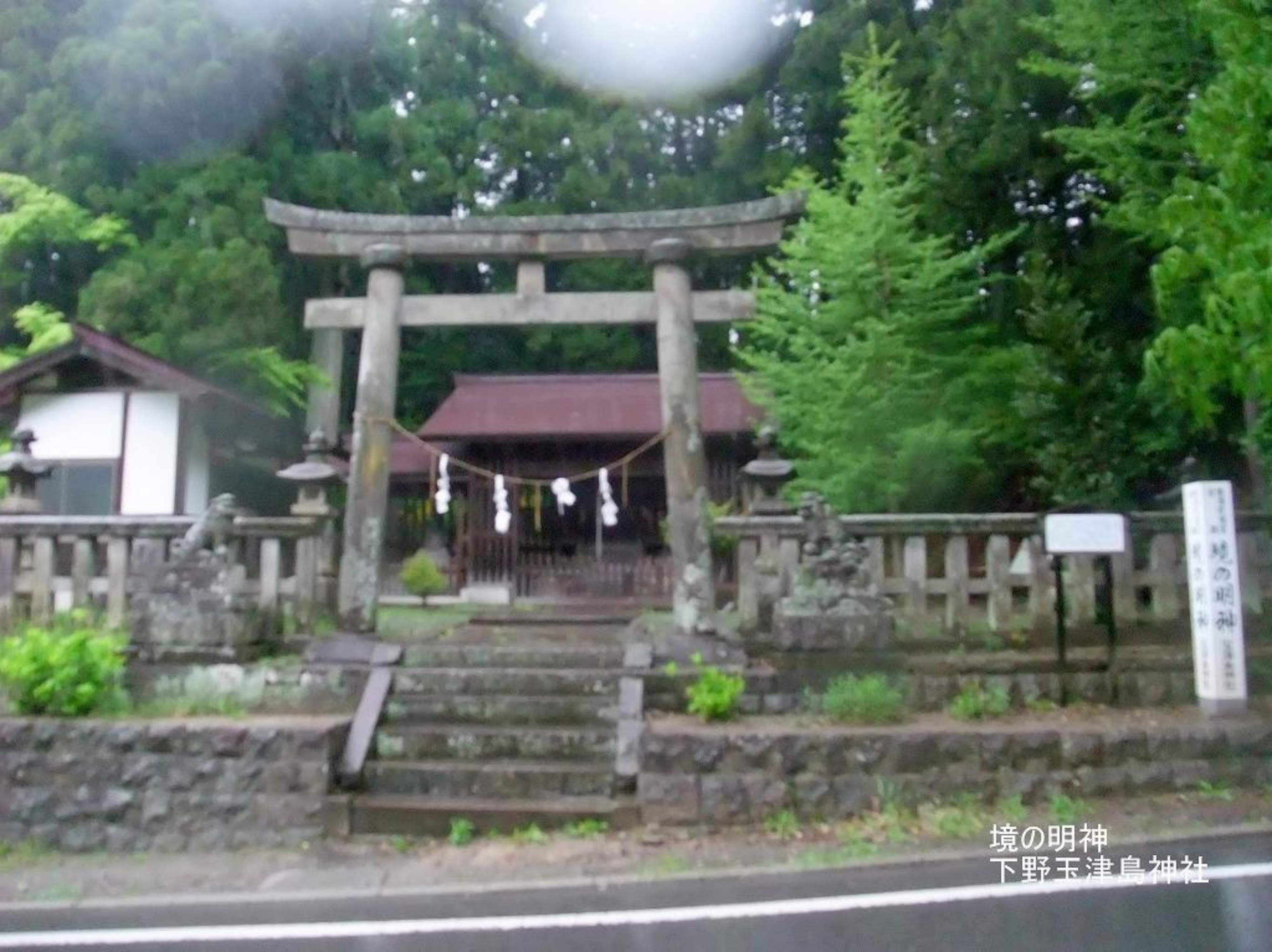
境の明神 下野玉津島神社