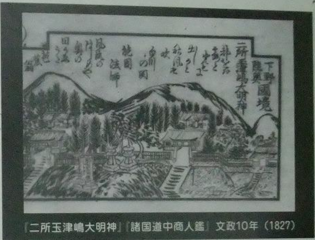
二所玉津嶋大明神 諸国道中商人鑑 文政10年(1827)

旧奥州街道に面して、陸奥(福島県側)と下野(栃木県側)の国境を挟んで境の明神が二社並立している。陸奥側の境の明神は、玉津嶋明神を祀り、下野側の明神は住吉明神を祀っている。