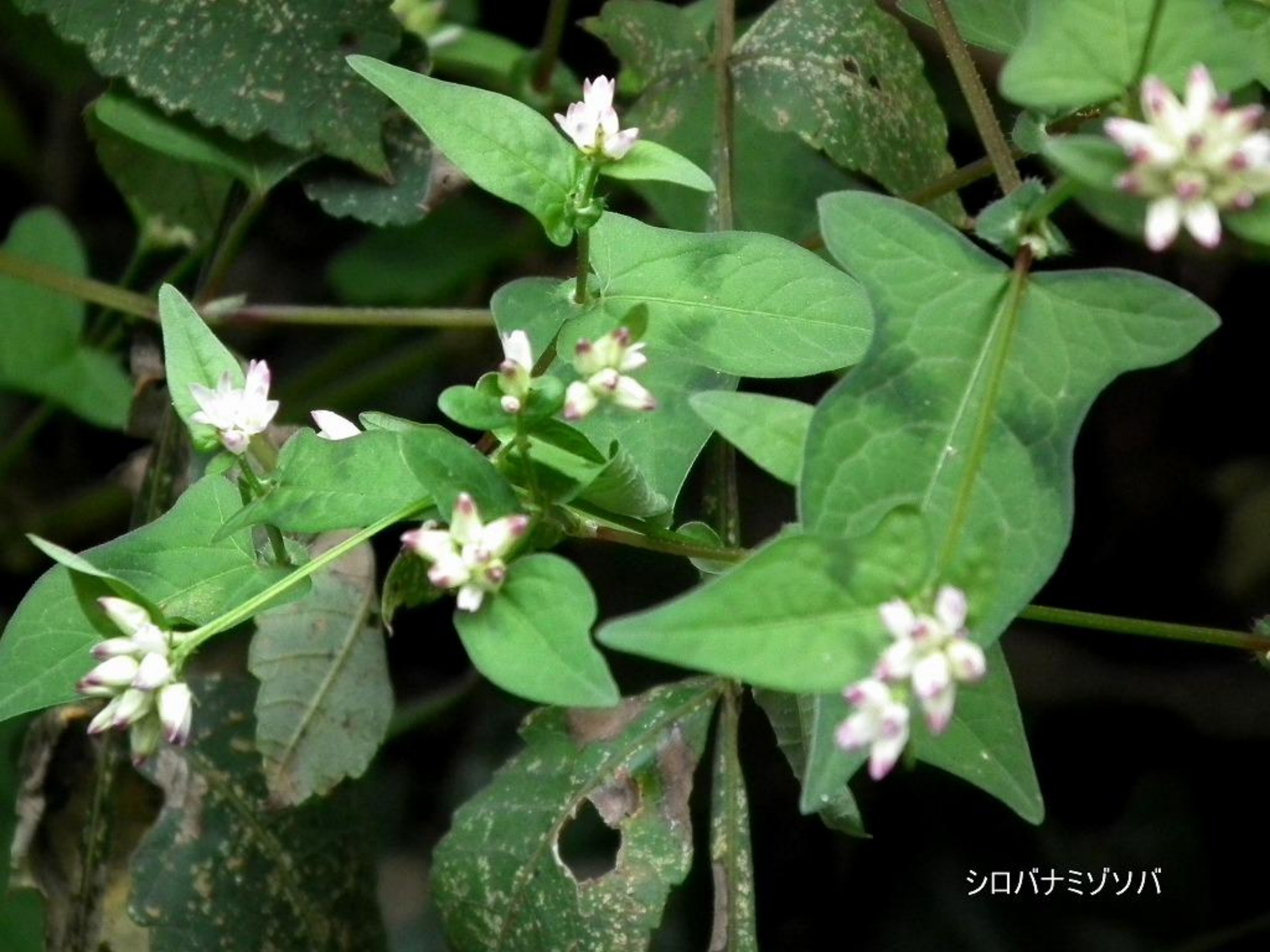
シロバナミゾソバ