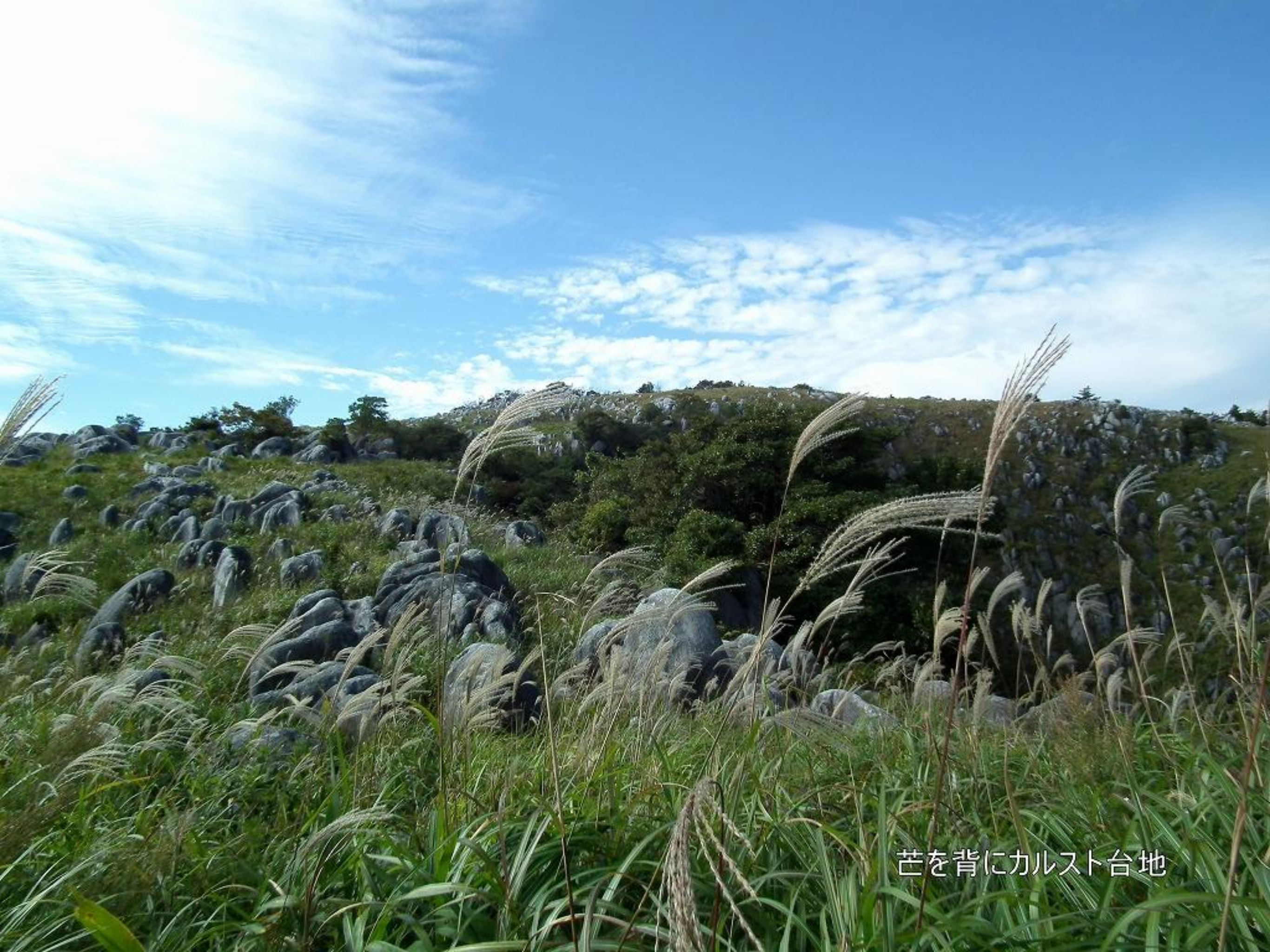
芒を背にカルスト台地