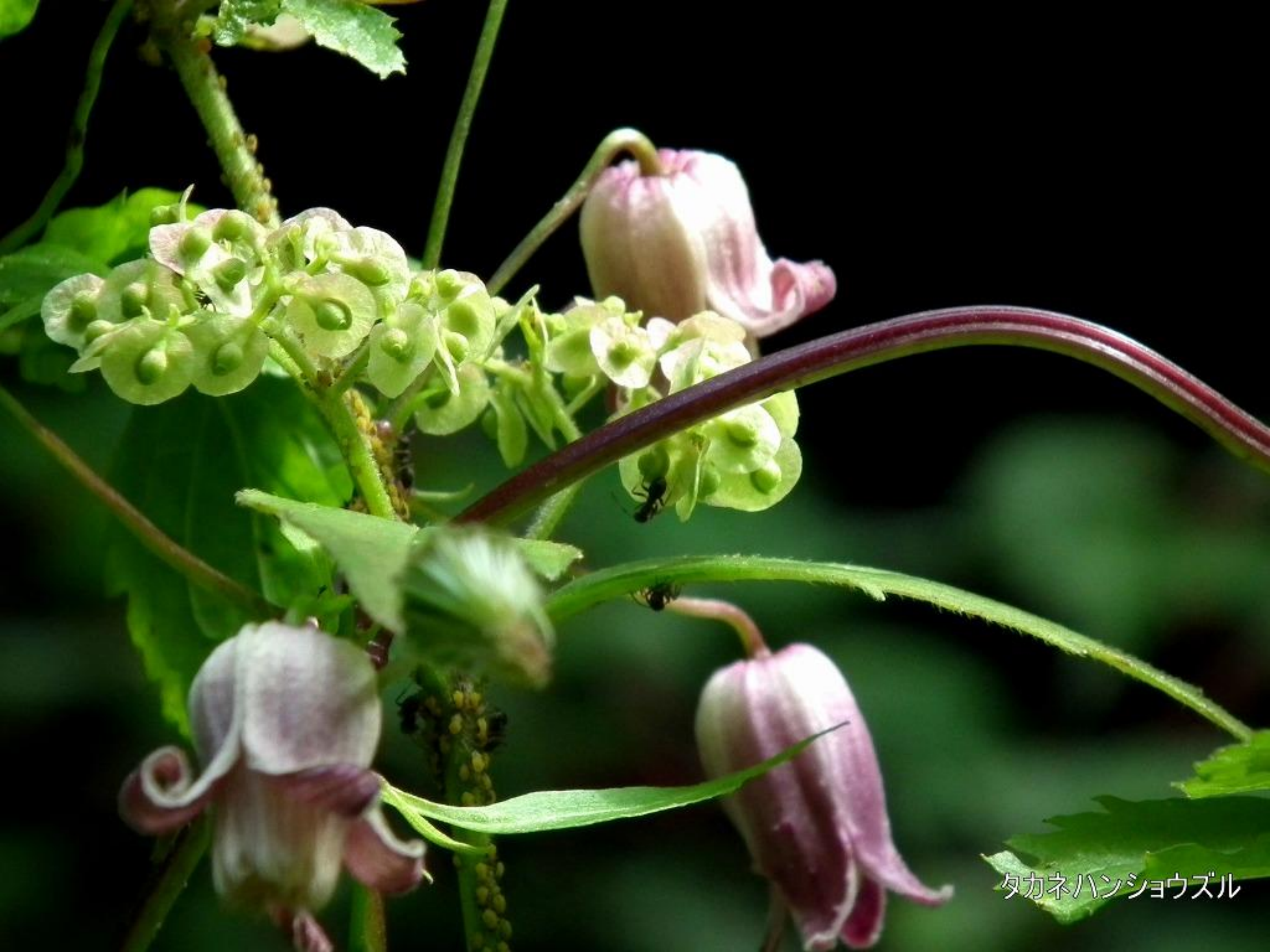
タカネハンショウズル