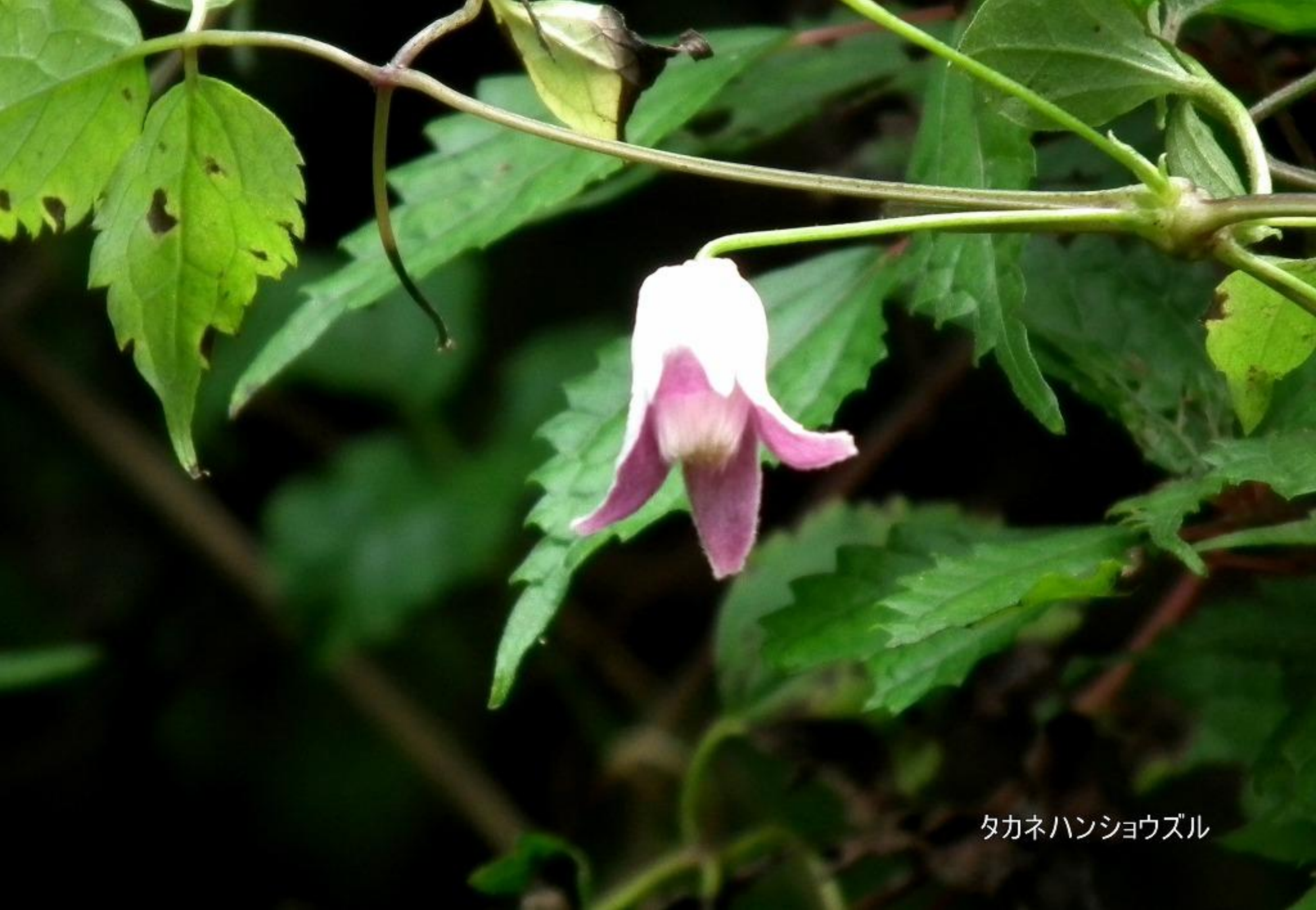
タカネハンショウズル