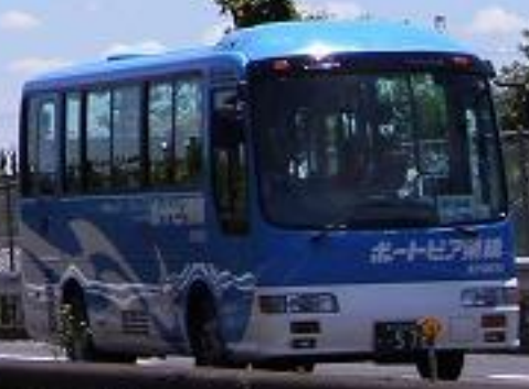
左の細い道が旧道

↑ 東京 54 Km Tokyo 4 上野 50 Km Ueno 春日部 18 Km Kasukabe