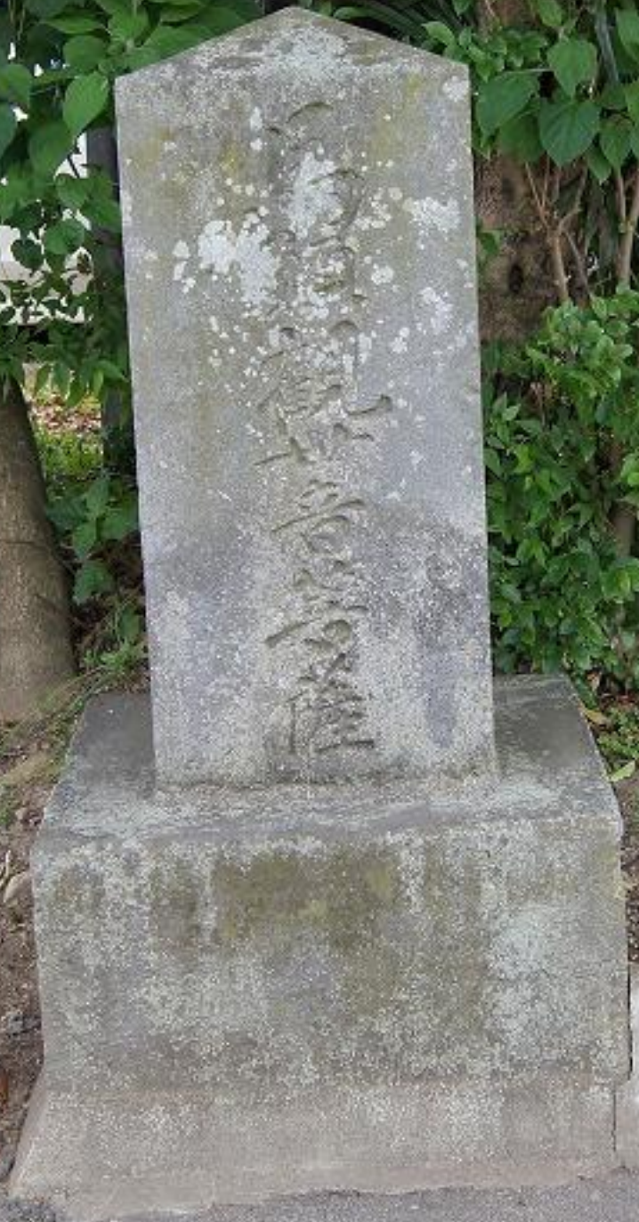
御成街道道しるべ