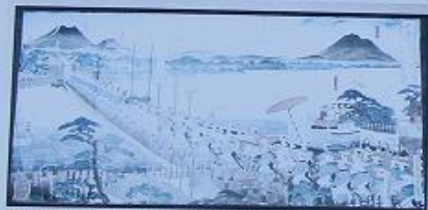
日光社参の行列 利根川上流工事事務所の配慮で、今回ここに移設された。